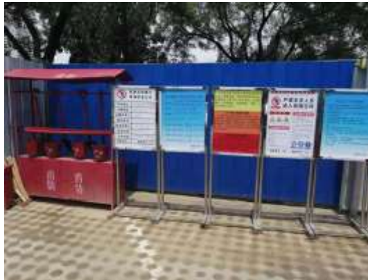
制定重污染天气应急预案、安全生产及环境保护相关制度