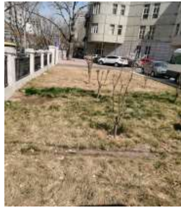
临时占用绿地进行绿化植被恢复