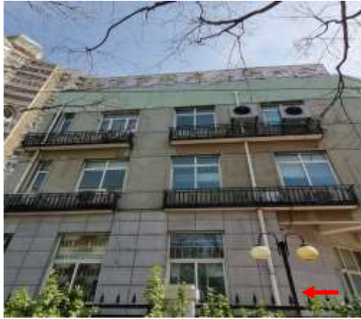
北京市残疾人联合会