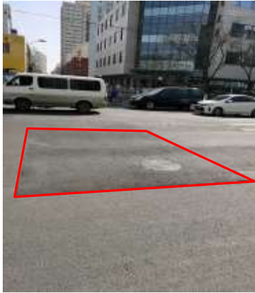
临时占路进行路面恢复