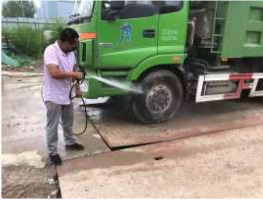
对驶离工地车辆轮胎进行冲洗