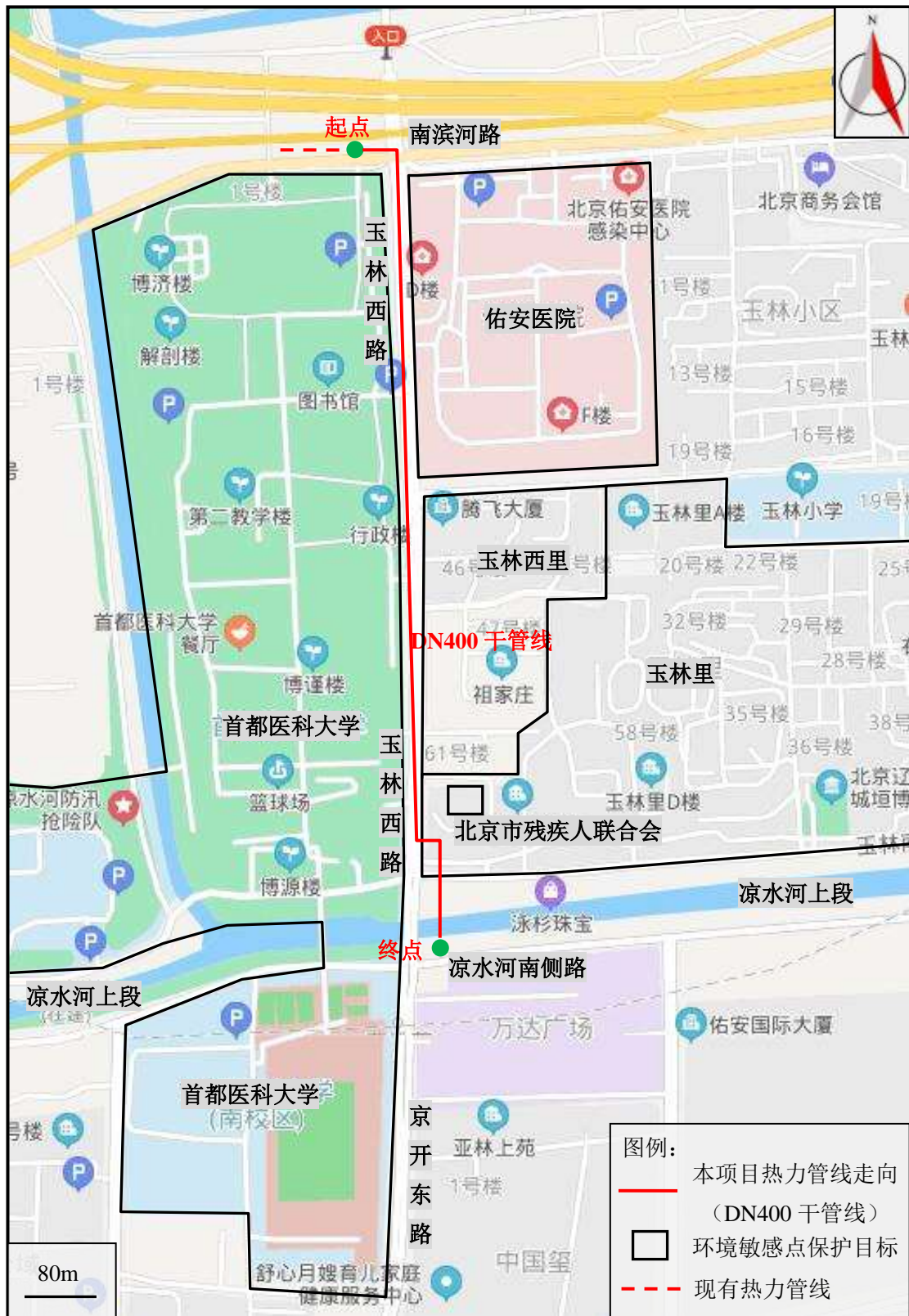
附图 2 项目热力管线线路走向图