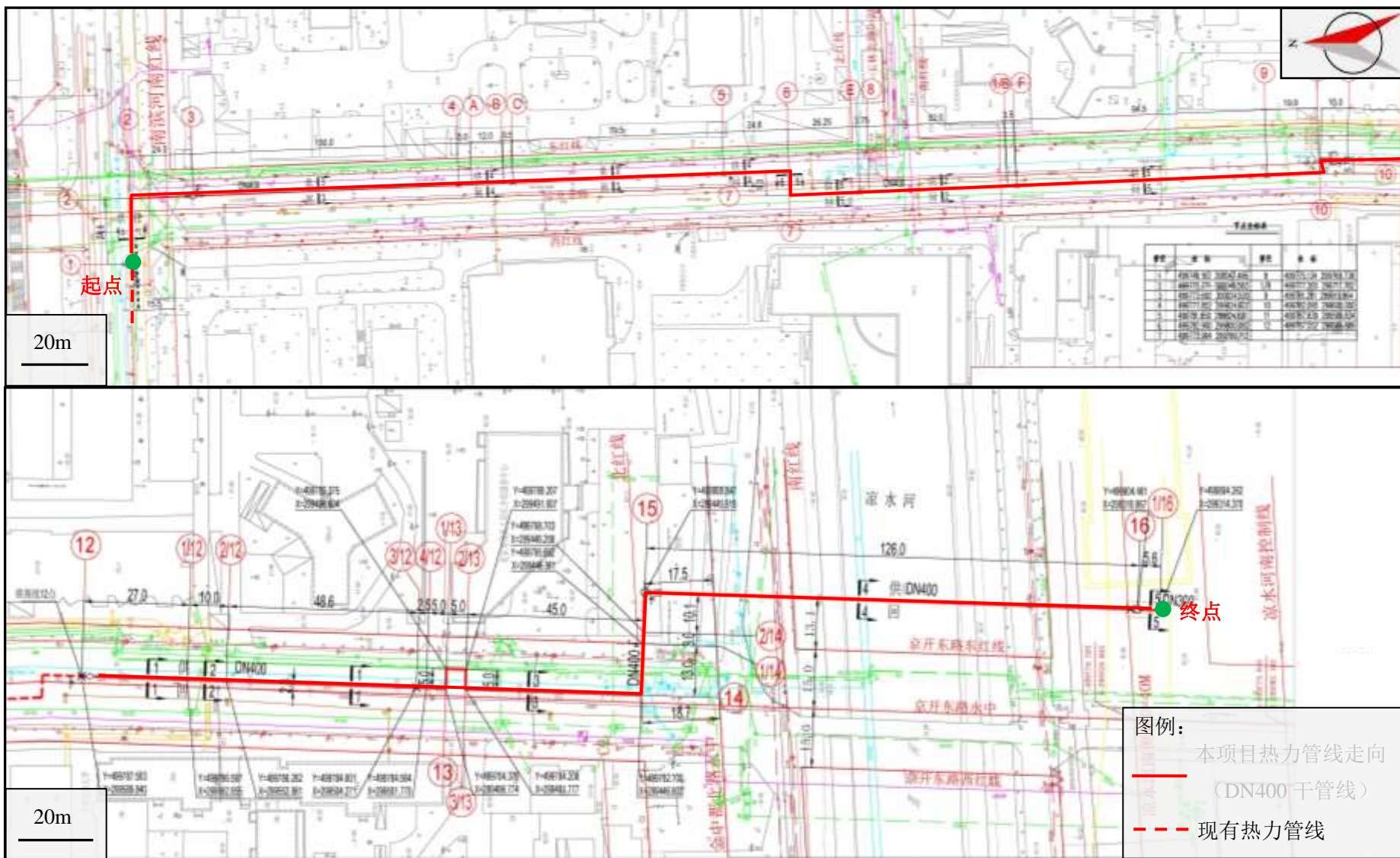
附图 3 项目热力管线平面布置图